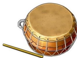
ブク / 북