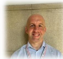
写真は 滋賀県HPより