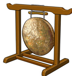
チン / 징