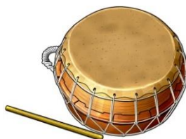
ブク (ブク) / 북